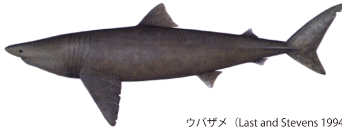
ウバザメ (Last and Stevens 1994)