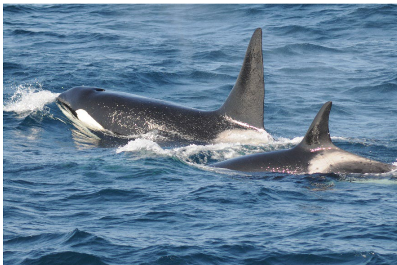
シャチの群れ 雄の背鰭は直立して高い